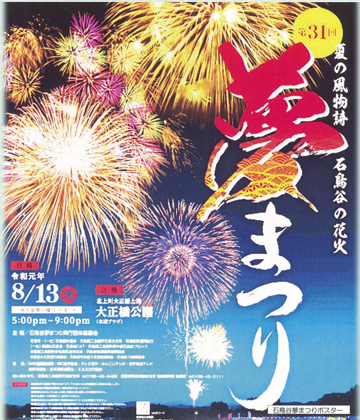
石鳥谷夢まつりポスター