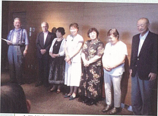
自己紹介する石鳥谷町人会の面々

ョンです。残念な事に、目の前にそびえ立つ「スカイツリー」は、期待に反して展望台から上が雲の中でした。