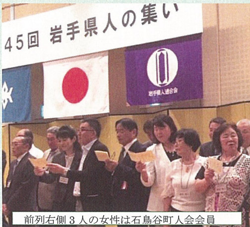
前列右側3人の女性は石鳥谷町人会会員

会員同士の懇談で会はさらに盛り上がり、最後は全員で「ふるさと」を合唱し、来年またお会いすることを楽しみに閉会となりました。